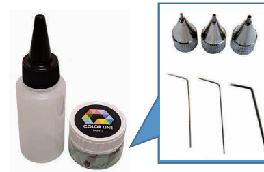
付属品：ペン先3種 空きボトル1本